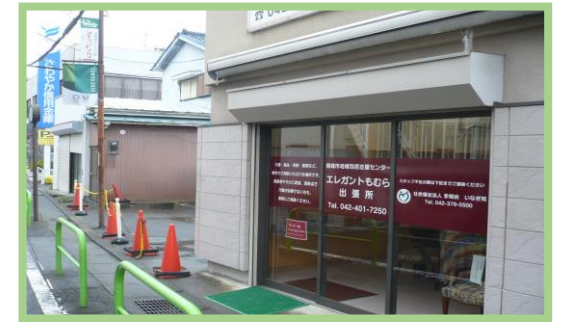
【エレガントもむら出張所 外観】