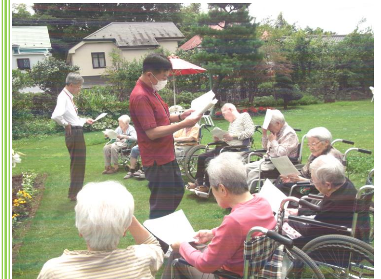
【苑庭の百合の前で利用者様と共に歌を楽しむ】